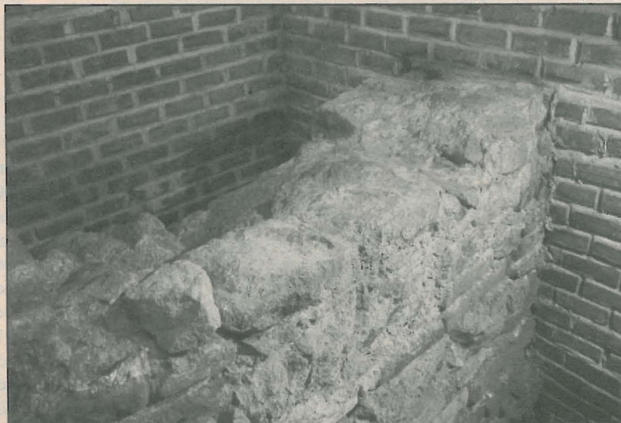
Parte da muralha do Forte do Brum, localizada durante escavações arqueológicas

PORTA DA TERRA – Mais uma porta do passado se abre nos estudos realizados pela Universidade. Terá início este ano a busca do outro baluarte que compunha a chamada Porta da Terra, pântão da muralha de proteção do Recife, erguida no período do governo de